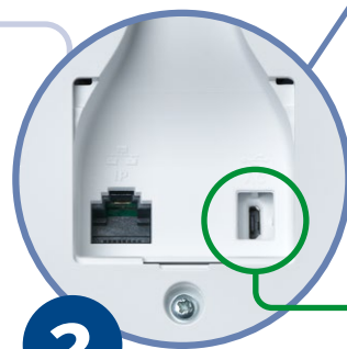
Buchse für Stecker

Die Form des Steckers ermöglicht das Einstecken nur, wenn der Stecker richtig gedreht ist!