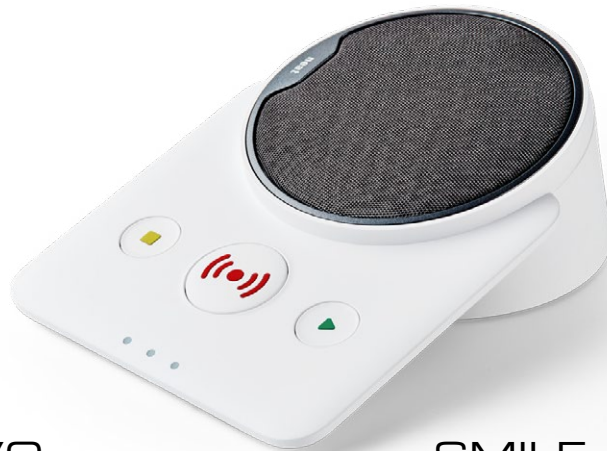
NOVO Das Hausnotrufgerät